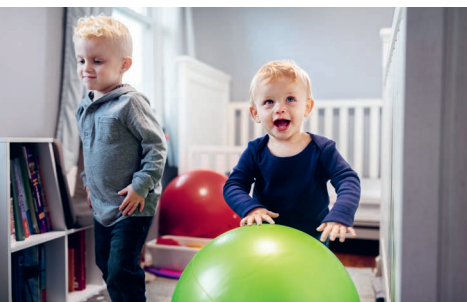
Beim Projekt Purzelbaum bewegen sich die Kinder aktiv.

Mit grosser Zufriedenheit nahmen wir ein wegweisendes Bundesgerichtsurteil zur Kenntnis: Die Opferhilfe wurde verpflichtet, einer Frau, die psychische Gewalt erlitten hatte, den Aufenthalt zu finanzieren. Dieser Entscheidung ist ein bedeutender Schritt, um Frauen, die psychische Gewalt erleiden, die dringend benötigte Unterstützung zu sichern.