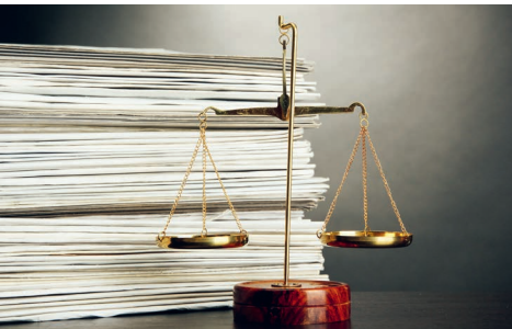
Bedeutendes Urteil für Frauen, die psychische Gewalt erleiden.