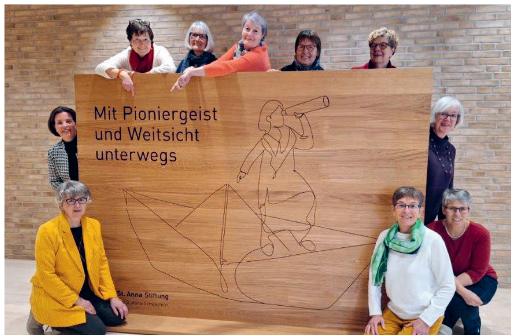
Dank der St. Anna Stiftung und vielen engagierten Frauen sind die Schwestern gut umsorgt.