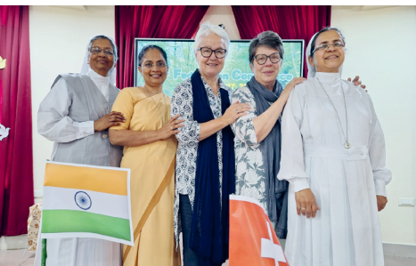
Mitglieder der Föderationskonferenz 2025 in Indien. Mission St. Anna