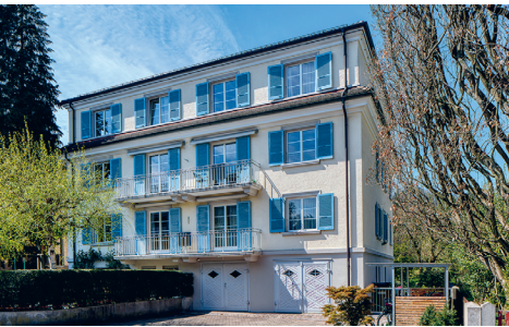
Die neue Strategie eröffnet dem Haus Hagar neue Perspektiven. Nique Nager