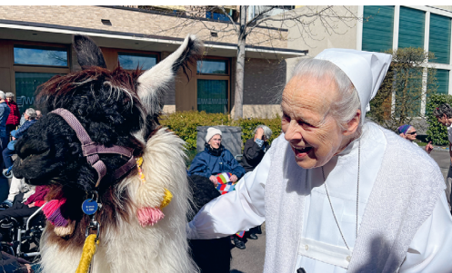
Die Lamas sorgten für Freude und Abwechslung im Alltag. Eva D'Andrea

rollende Umsetzung hat sich bewährt und erlaubt flexible Anpassungen. Ein zentrales Projekt ist die Tagesstätte für Menschen mit Demenz, die 2026 eröffnet wird. Das Angebot folgt der Prämisse der Schwesterngemeinschaft, der Not der Zeit aktiv zu begegnen. So entsteht im Raum Luzern ein bedarfsgerechtes Angebot, das Betroffene begleitet und Angehörige spürbar entlastet.