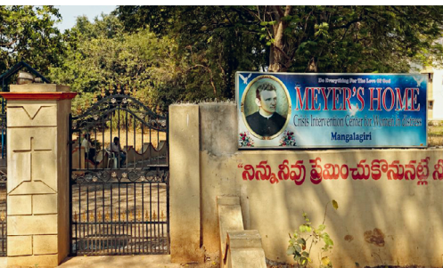
Meyer's Home in Mangalagiri. Matthias Muff

gesetzt. In Indien rücken die Gesundheitseinrichtungen in den Fokus und werden auf neue Standards gebracht. Die Schwestern der Provinz Ostafrika planen mit einem Nursing College einen zukunftsweisenden Schritt: neue Berufschancen für junge Menschen, Vorsorge gegen Pflegenotstand und neue Dynamik für das St. Ann's Hospital in Tabora.