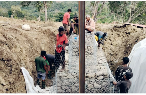
Schutzbauten für mehr Sicherheit.