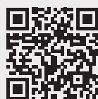
Mission St. Anna