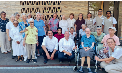
Abreise einiger Schwestern in die Gemeinschaftsferien.

So sieht es meist aus, wenn wir Schwestern uns verabschieden – wie auf dem Bild auf dem Weg zu den Seniorenferien in Interlaken. Es ist immer ein besonders schöner, wertvoller und berührender Moment, wenn Mitarbeitende unserer Stiftung dabei sind. Sie unterstützen und begleiten uns herzlich, helfen die Koffer sorgfältig einzuladen, organisieren und bereiten alles